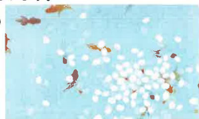
「ハナモヨウ」神戸智行

■途中、お昼の休憩(12~13時)を挟みますが、昼食は各自ご用意いただきますようお願いいたします。